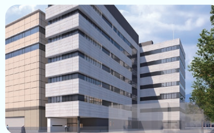
アルプスビル別館新築(2026年5月竣工予定)

厚生労働省「女性活躍推進法に基づく認定制度に係る基準における平均値 適用：令和7年7月1日～令和8年6月30日」 IT企業としては女性の割合が高い(約45%)