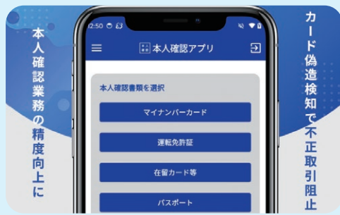
銀行員向けの「本人確認アプリ」

銀行員が使用するシステムの開発や、銀行のお客様が使用するATMの維持管理、銀行全体の業務環境の構築など、幅広い分野を手がけています。さらにスマホアプリ開発にも注力しており、本人確認アプリを新たに開発しました。