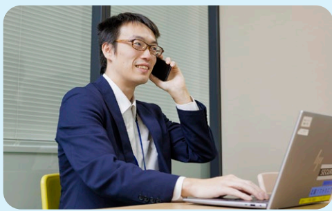
お客様とやりとりしている様子

上流工程のアイデア・企画から業務のシステム化の実現に向けて技術支援を行い、北陸銀行・北海道銀行でニーズの高い商品を開発。その商品は、他の金融機関に対しても汎用性が高く、取引先は第一・第二地銀の3割強を占めます。